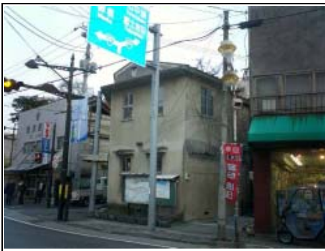
船津三差路旧交番