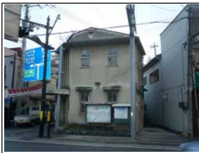
船津三差路旧交番