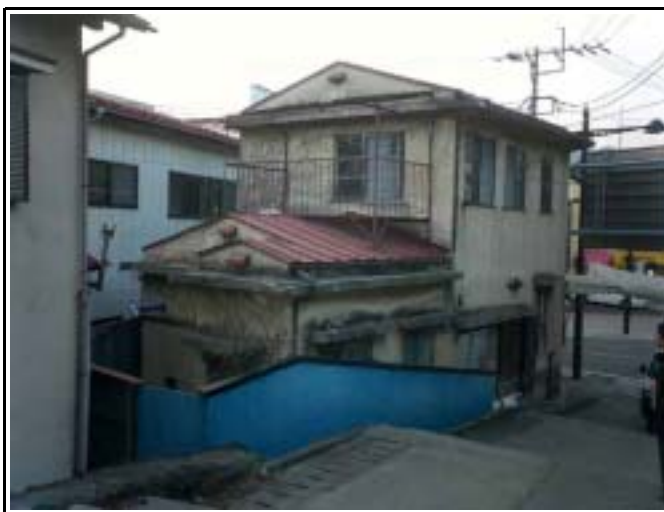
船津三差路旧交番