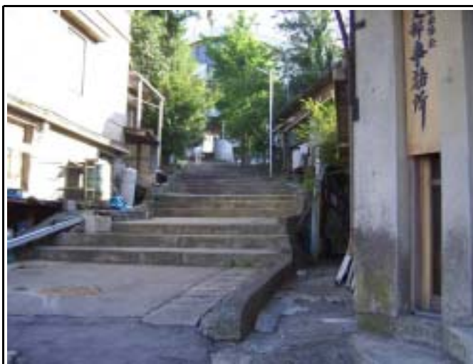
船津三差路旧交番