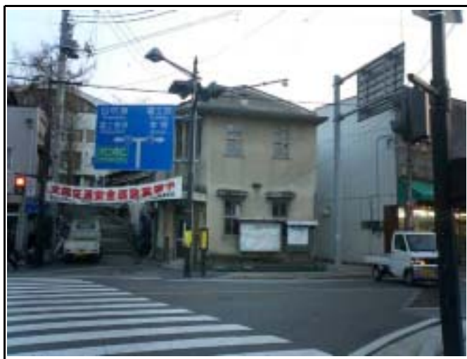
船津三差路旧交番